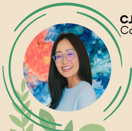
CJ Oveisi Capital Group